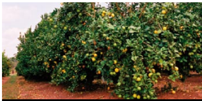
Árbol con fruta