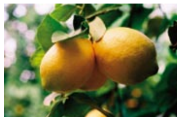
Forma de la hoja